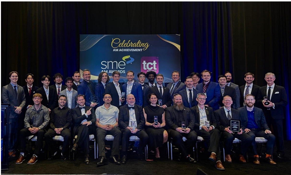
Bild 1: Gruppenfoto der Finalisten und Gewinner der TCT Awards 2026 im Rahmen der RAPID + TCT in Boston. Die Veranstaltung bringt führende Unternehmen und Innovatoren der additiven Fertigung zusammen.

Mit der MMJ ProX-Serie erschließt AMAREA Technology neue Anwendungsfelder, u.a. in Branchen wie Medizintechnik, Halbleiterindustrie, Luft- und Raumfahrt, Schmuck sowie Präzisionsinstrumentierung. Die Kombination unterschiedlicher Materialien innerhalb eines Druckprozesses ermöglicht die Herstellung funktionalisierter Bauteile mit neuen Eigenschaften und reduziert gleichzeitig den Ressourcenverbrauch, da Material ausschließlich dort abgelegt wird, wo es benötigt wird.