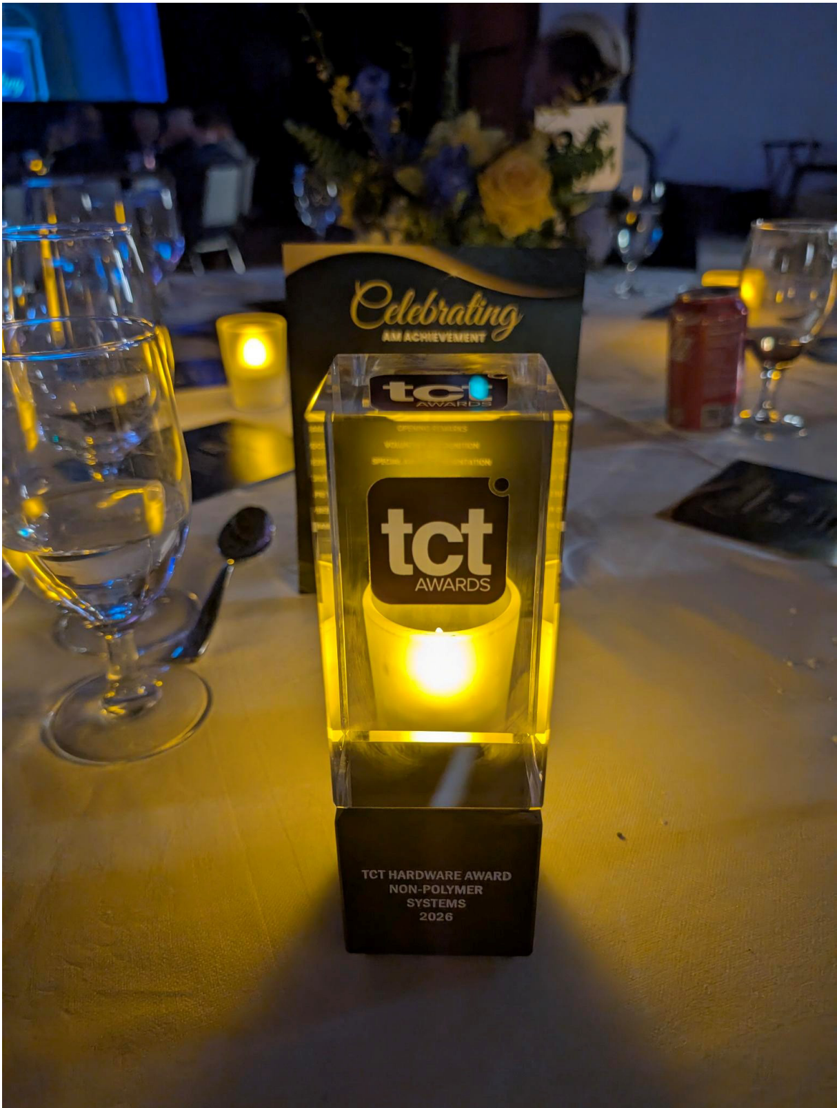
Abbildung 3. TCT Hardware Award 2026 in der Kategorie „Non-Polymer Systems“, verliehen an AMAREA Technology für die MMJ ProX-Serie.